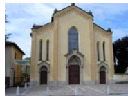
Parrocchia SS. Redentore Bettola d'Adda