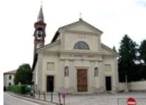
Parrocchia S. Antonio Abate Pozzo d'Adda